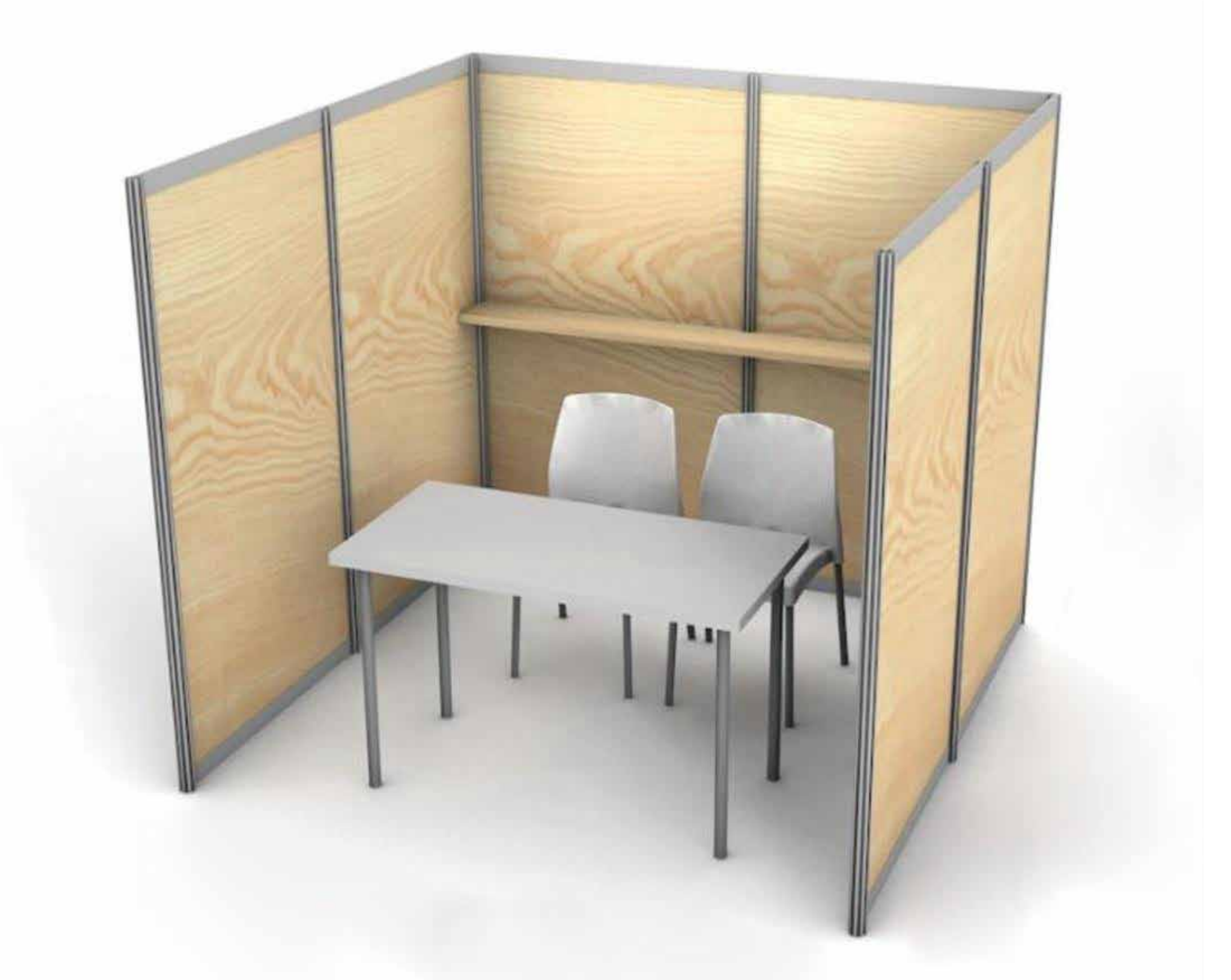
Imagen de referencia de stand (no incluye mesas ni entrepaños)